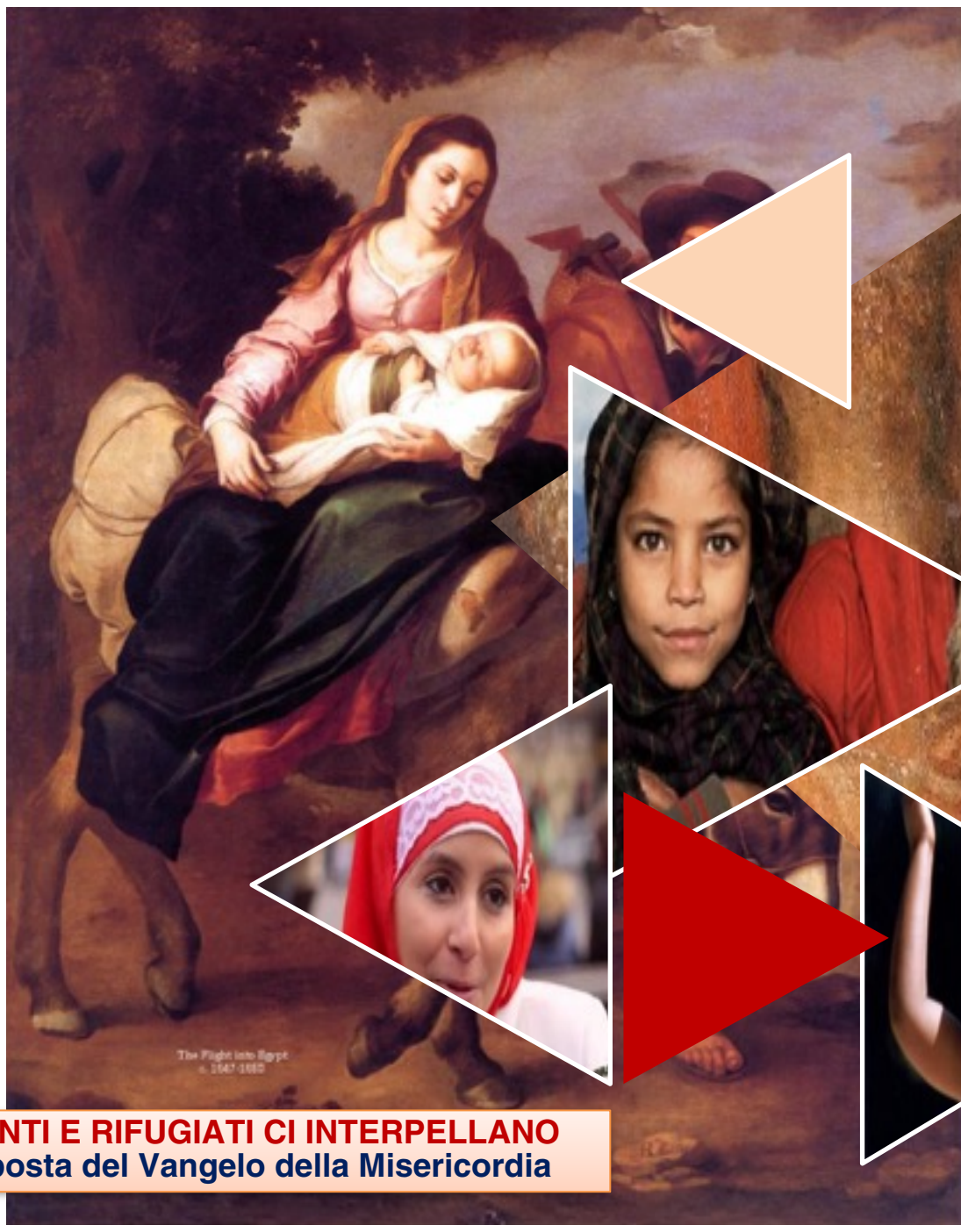
The Flight into Egypt c. 1547-1550

MIGRANTI E RIFUGIATI CI INTERPELLANO La risposta del Vangelo della Misericordia