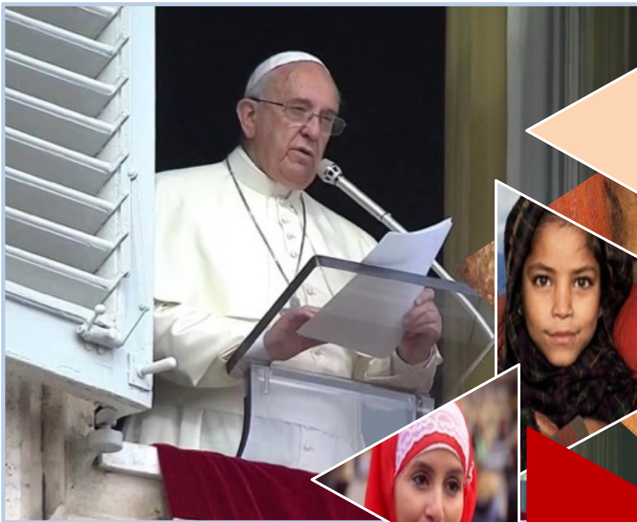
Angelus, 6 settembre 2015.