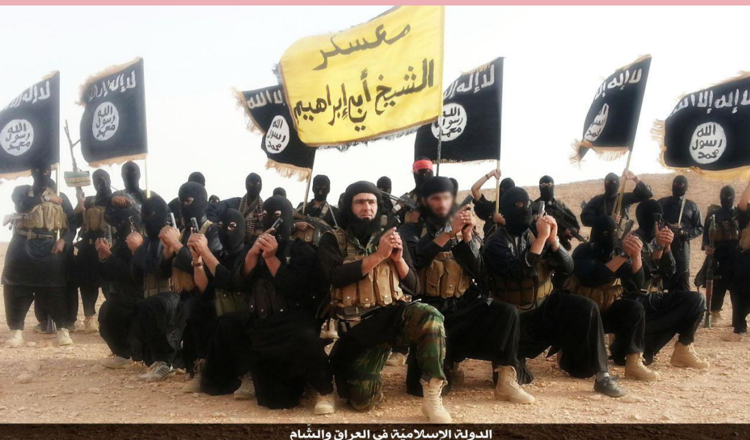
الدولة الإسلامية في العراق والشام

Un'interpretazione troppo radicale, ossia letterale ma distorta, di qualsiasi religione porta ad un radicalismo. Questo è particolarmente vero nel caso della religione islamica, che può condurre ad un vero e proprio odio nei confronti dei non musulmani o di quanti non praticano l'islam radicale.